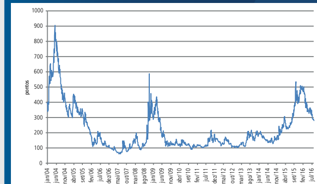
Percepção de risco do mercado (CDS Brasil 5 anos)